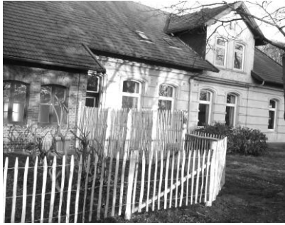
Höhe 100 cm - 8 cm Zwischenraum

Dieser robuste und langlebige Zaun ist vielfältig verwendbar und einfach zu montieren. Die Kastanienwälder Frankreichs liefern das Rohmaterial für Zäune und Pfähle. Die nachhaltige Waldwirtschaft beruht auf folgendem Prinzip: Ähnlich wie bei Weiden treiben aus dem Stock neue Schösslinge aus. Diese schlanken Ruten wachsen zu 6 - 12 cm starken Stämmen heran und werden dann geerntet. Der Kreislauf beginnt wieder von Neuem. Schon die Winzer schätzen diese graden und zähen Stangen und Pfähle zum Anbinden der Weinreben, da das Holz von Natur aus eine sehr gute Haltbarkeit hat. Zaun und Pfähle werden in einem Betrieb in Frankreich hergestellt.