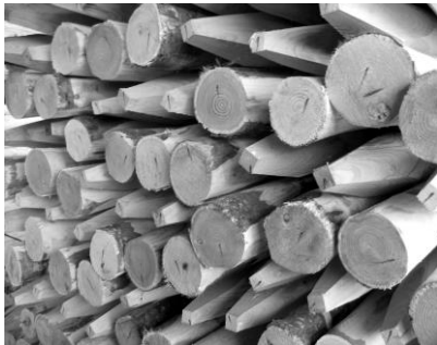
Kastanienpfähle Ø 8-10 cm