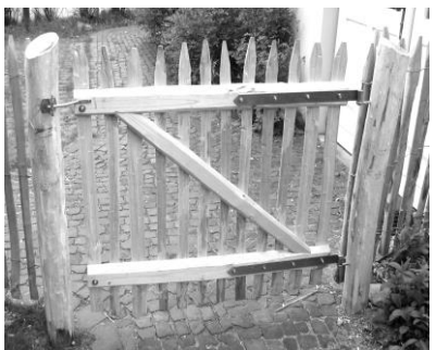
Tor 100 x 100 cm 4 cm Zwischenraum rechts aufgehängt