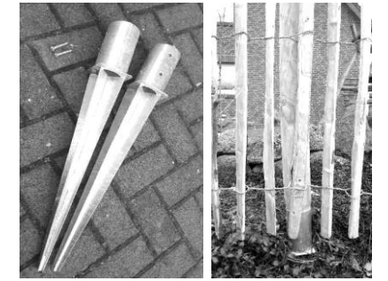
Einschlagbodenhülse rund, Ø 8 cm 2mm /3mm Blechstärke, 2 Schrauben

Einschlagbodenhülse rund, Ø 8cm, Länge 72cm, feuerverzinkt: 8,80 € / 2 mm ; 10,90 € / 3 mm Blechstärke Pfähle für Bodenhilfen unten auf 8 cm Ø gefräst: 100 cm Länge 8,- €/Stk. - 120 cm Länge 9,- €/Stk. 150 cm Länge 10,- €/Stk. - 175 cm Länge 11,50 €/Stk.