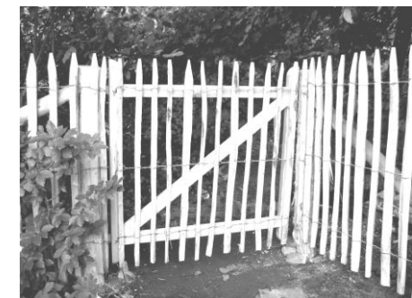
Torrahmen aus Lärchenkantholz mit befestigtem Zaunstück, Höhe 100 cm - 4 cm Zwischenraum

Zubehör: Edelstahlschraube A2 mit Bohrspitze, Fräsrillen und magnetischem Kopf : 40 Stück 7,50 € / 100 Stück inkl. TX 20 Bit 16,50 €