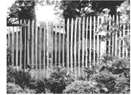
Höhe 150 cm - 4 cm Zwischenraum